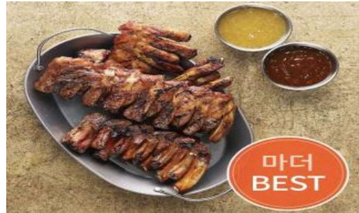
<제품 적용 사진>